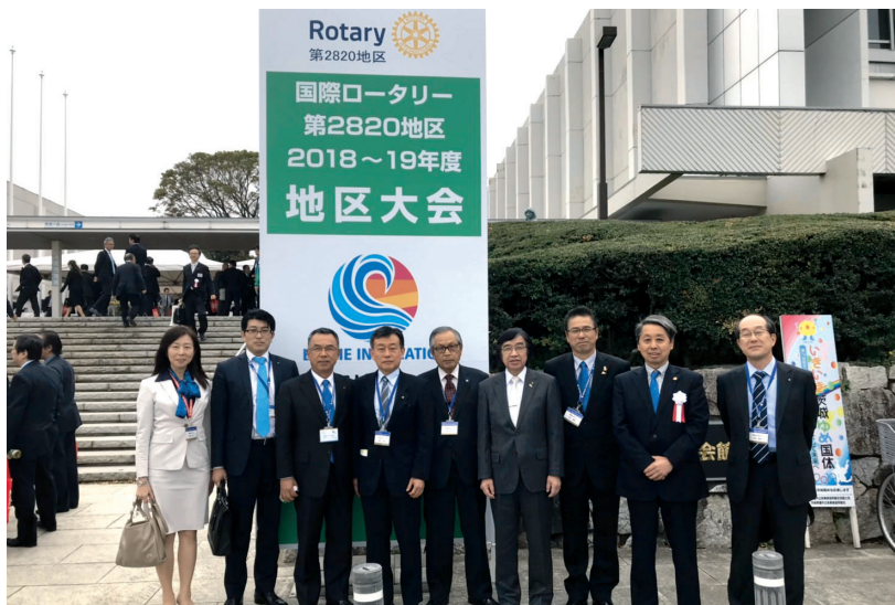
4月21日地区大会 参加者