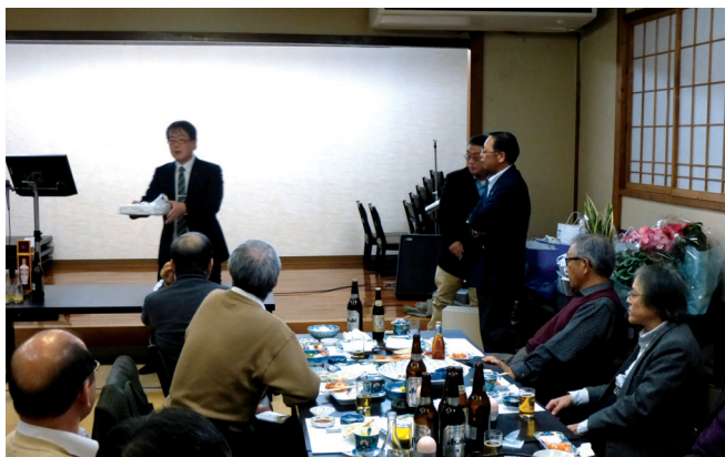
オークション風景