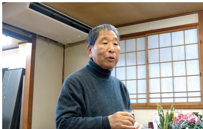
富永会員の乾杯の挨拶