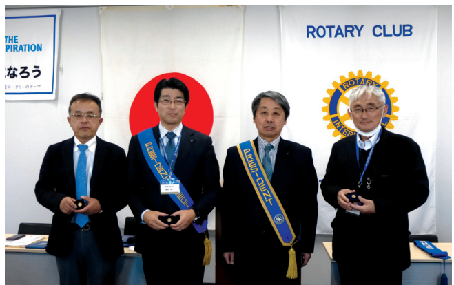
ポール・ハリス・フェロー（左より 野内、篠原、小祝各会員）