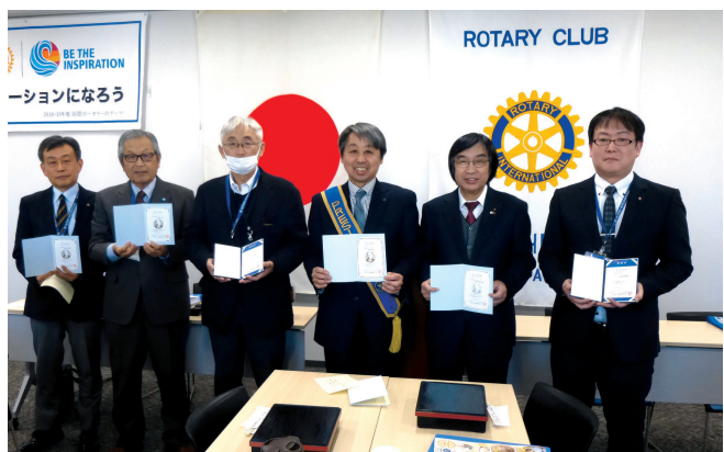
米山功労者各受賞者