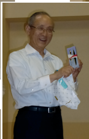
和田地区委員へ記念品贈呈